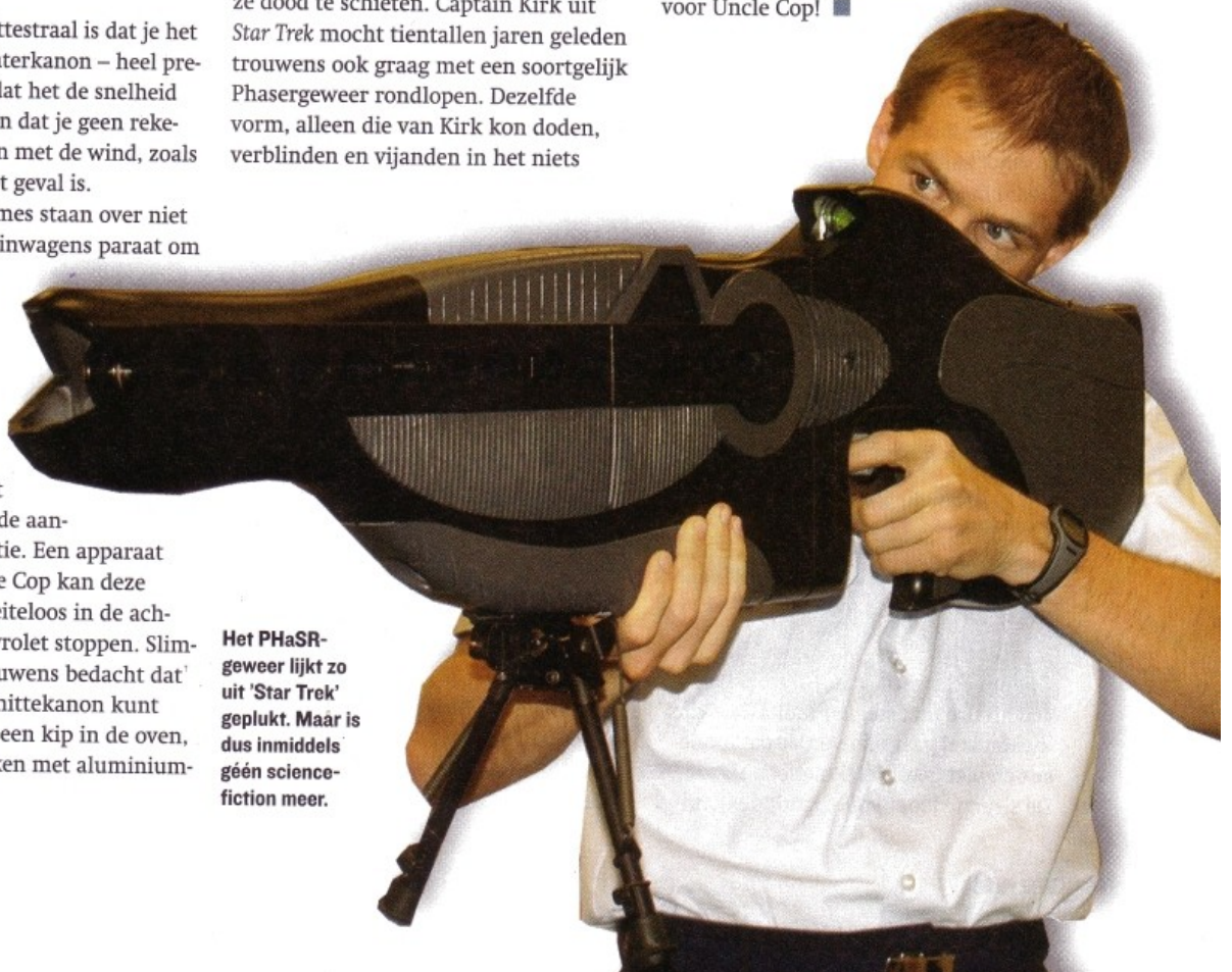
Het PHaSR-geweer lijkt zo uit 'Star Trek' geplukt. Maar is dus inmiddels géén science-fiction meer.

In het verleden waren lasers te krachtig op korte afstand en nutteloos op grote afstand. De PHaSR van nu kan met een afstandmeter bepalen tot op welke afstand het gebruik veilig is voor de ogen. Wees dus maar aardig voor Uncle Cop! ■