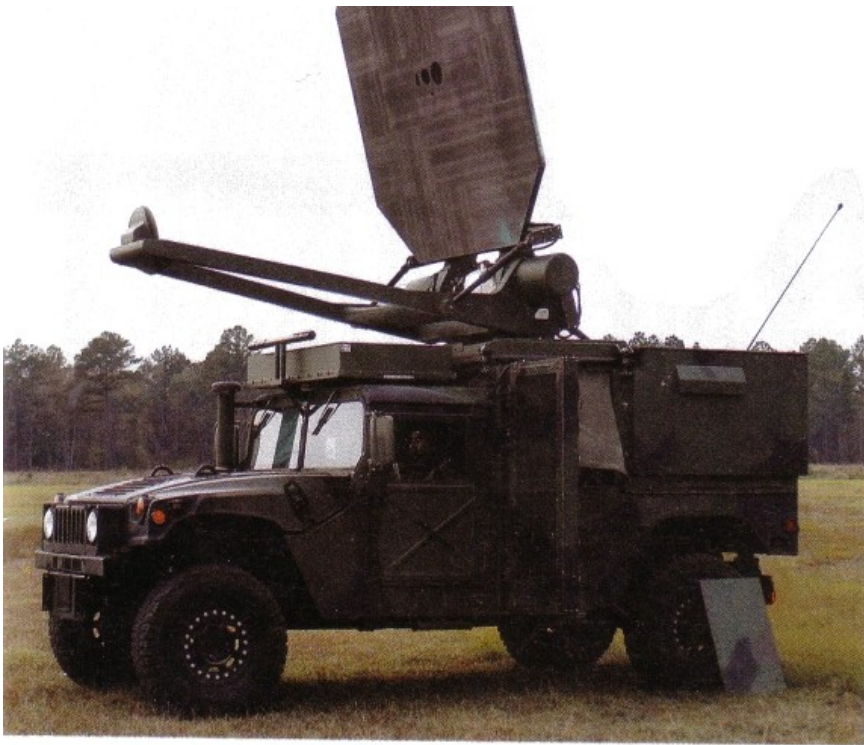
Demonstranten krijgen voortaan te maken met dit hittekanon.